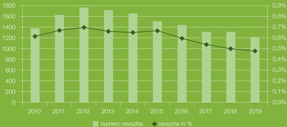
Fig. 3: Il numero di licenze revocate durante il periodo di prova, nell'anno in rassegna, è diminuito